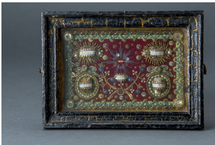
Reliquaire fin 18ème siècle, provient d'une église du Cantal. Avec sceau au dos - Inv.77.15.109