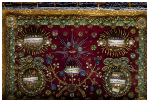
Reliquaire de voyage à deux faces, provient d'une église du Cantal