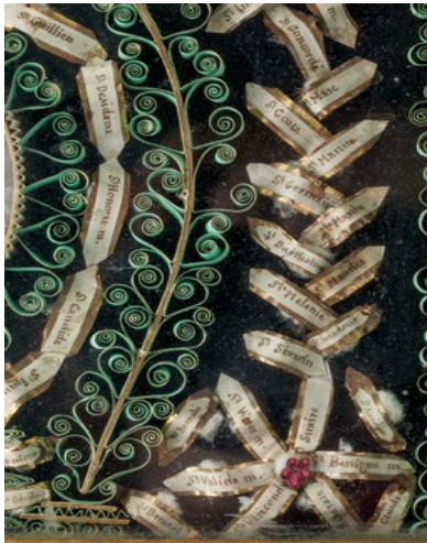
Détail d'un reliquaire, 19ème siècle, provient d'une église du Cantal - Inv.77.15.113

des visuels à votre disposition sur simple demande à communication.musees@aurillac.fr