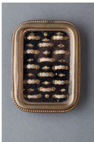
Reliquaire de voyage, 10,5 x 8 cm, 19 e siècle, provient du couvent des Clarisses - Inv.77.15.100

Minutieusement confectionnés et décorés du 17 e au 19 e siècles par des sœurs cloîtrées (Carmélites, Visitandines, Ursulines...), ces cadres sous-verre de forme rectangulaire ou ovale, abritent des reliques de saints, disséminées au milieu d'une végétation luxuriante faite de papiers roulés. Le caractère ornemental de ces décorations appelées aussi depuis les années 1980 «paperoles» a bien failli causer leur perte. En effet, nombre de ces reliquaires ont été jetés voire détruits car jugés trop exubérants suite aux recommandations de la Réforme liturgique du Concile Vatican II (1962-1965) préconisant pour ces objets de culte « une noble beauté plutôt que la seule somptuosité ».